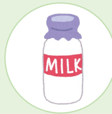
飲用牛乳 (成分調整牛乳を除く。)